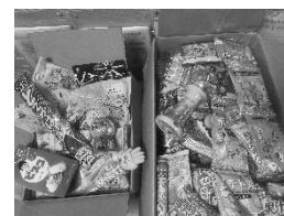
寄附いただいた食品