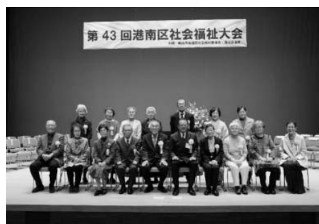
受賞者のみなさん