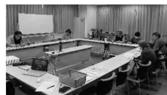
Bブロック会議（オンライン会議）