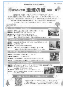
『ほっとひと息地域の場 (チラシ)』