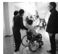
東永谷中学校車いす体験