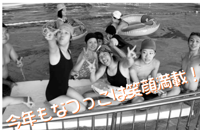
今年もなつっこは笑顔満載！

この事業では、①子どもたちに夏休みの楽しい時間を過ごしてもらうこと ②保護者や家族の休息時間をつくる(レスパイト)こと ③ボランティアの輪を広